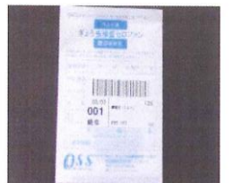
ぎょう虫検査用氏名ラベルを 袋の氏名欄に貼ります