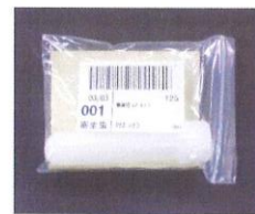
寄生虫検査用氏名ラベルを 容器の袋に貼ります

3つとも名前 なまえ のラ ベルをしっかりと はってね!(けんさご とにラベルがきま っています!)