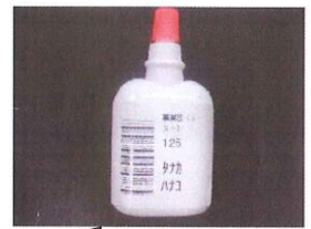
尿検査用氏名ラベルを 採尿容器に貼ります

ぎょう虫 ちゅう は、夜 よる ねている間 あいだ に、 こうもんまではい出 だ して、たま ごをうみます。すると、おしり がかゆくなりおちつけません。