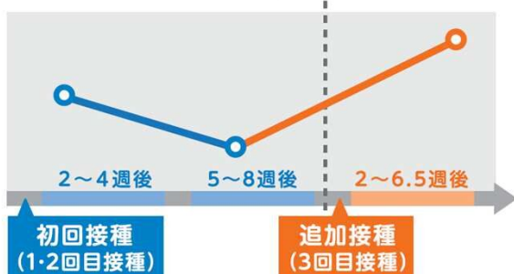
発症予防効果（イメージ）