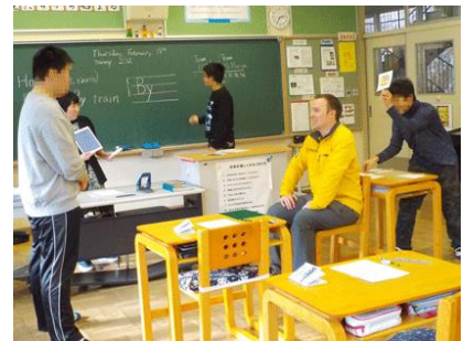
(英語の授業の様子)