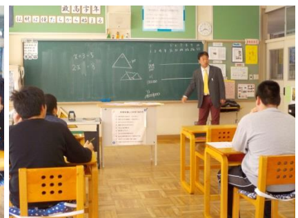
(数学の授業の様子)