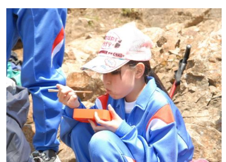
山でのお弁当は格別です。