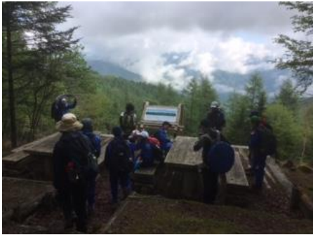
7時30分 ：展望台に到着