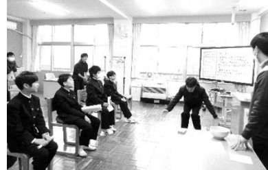
歓迎会 レクの様子

また、本年度、新しく「探究部」を創ることが新生徒会執行部から提案され、承認されました。生徒の主体性を、大切にしていきます。