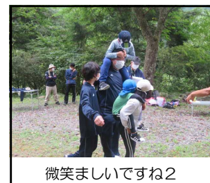
微笑ましいですね2