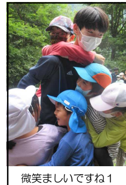
微笑ましいですね1