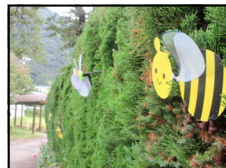
《遊び心2…音楽室隣の植え込みに》

生徒たちは、現在、小中運動会・清流祭の練習に精一杯取り組んでいます。きっと素晴らしい発表を披露すると思います。つきましては、新型コロナウイルス感染症も心配されますので、 生徒たちの活動を保証するため、ご家庭でも、基本的な感染症対策の徹底、睡眠や栄養などの体調管理などに努めてくださいますよう、あらためてお願い申し上げます。