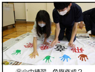
⑧小中練習 色旗作成2