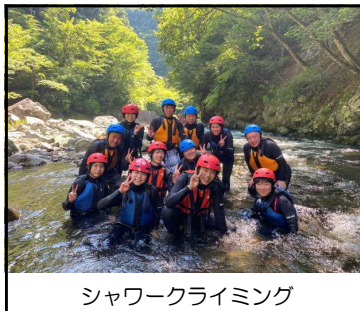
シャワークライミング