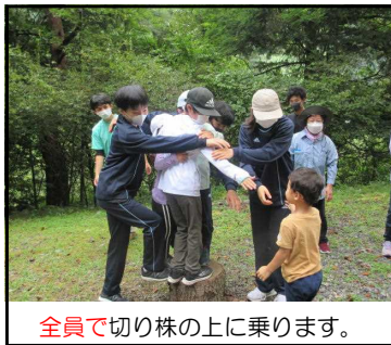
全員で切り株の上に乗ります。

先月、収穫体験、BBQ、シャワークライミングを実施し、先日は、森の中で、活動を通じた園児・児童・生徒の交流がありました。…。暑い盛りの清涼剤となりました。