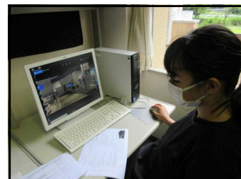
⑥1・2学年発表準備中