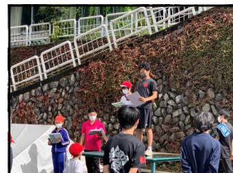
⑨小中練習 スローガン発表

★令和5年度に向けて、変化に対応するため、①学校経営の継続性・持続可能であるか、また②学校教育目標「ふるさと」の視点で、学校行事など検討作業に入りました。