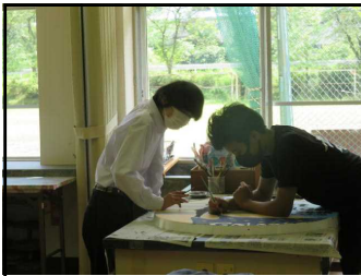
①シンボルマーク作成中