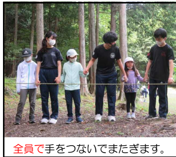
全員で手をつないでまたぎます。