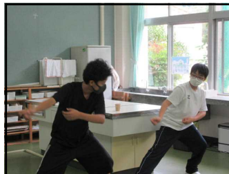
②ソーラン練習中…初体験！