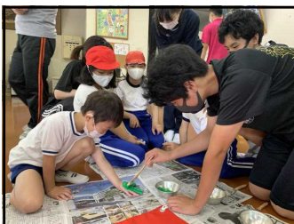
⑦小中練習 色旗作成1