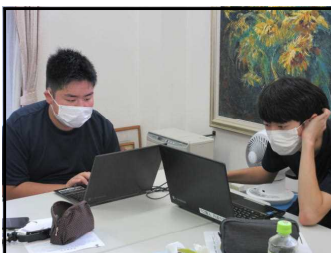
④生徒会本部 画面には何が…