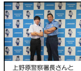
上野原警察署長さんと