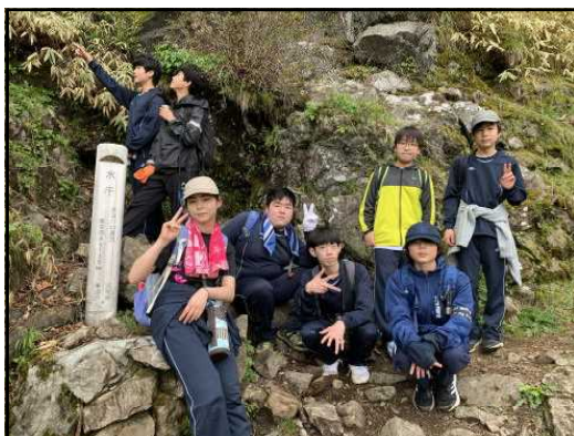
水干「多摩川の最初の一滴」