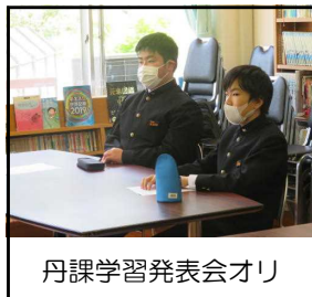
丹課学習発表会オリ

※丹課学習発表会 地域課題を見つけ、解決策を考えます。…高校の「探究」では、同内容が扱われます。