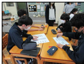
5/26発信の方法を考える