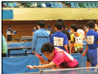
（5月7日春季大会から）

卓球は心理戦!! 戦術的なサービス。揺さぶり。試合展開の変化。逆に、簡単なミスから、相手有利に…。「この一球を大切に!」。 6月8日（水）は支部総体。 選手の活躍が楽しみです。