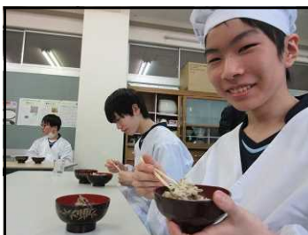
5/11実食 おいしくいただきました！