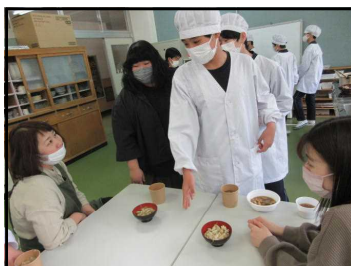
5/11お客様へ提供するにあたり

生徒たちは、①「かてめし」（当日は200食を予定）と「豚汁」（同100食）の試作品をつくらせたり、②どのようなかたちで販売をするのか発信の方法を考えたりしています。9月当日に向けて、 6月25日（土）には、プレ販売を予定 しています。詳細は、CA TVなどで、あらためてお伝えします。