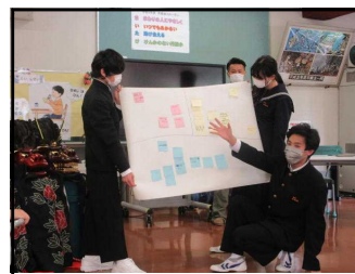
意見を発表する様子