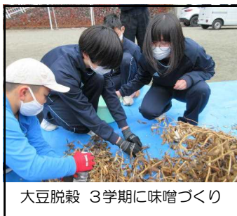
大豆脱穀 3学期に味噌づくり