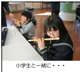
小学生と一緒に・・・