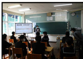
SDGs学習会 17の視点で新聞を読む