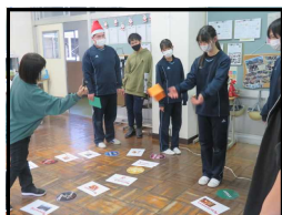
全校英語 クリスマスレク

今年1年大変お世話になりました。ありがとうございました。みなさま、よい年をお迎えてください。