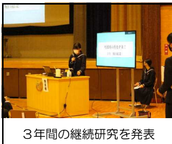
3年間の継続研究を発表

コロナ収束の兆しが心配される中、村長様をはじめとするご来賓、また村民の皆様などをご招待し、ようやく開催することができました。ご参加いただき、ありがとうございました。以下、お寄せいただいた感想を紹介させていただきます。