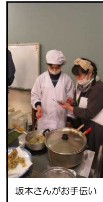
坂本さんがお手伝い