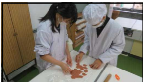
1年 ハロウィンレク