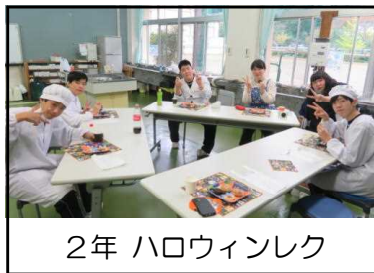
2年 ハロウィンレク