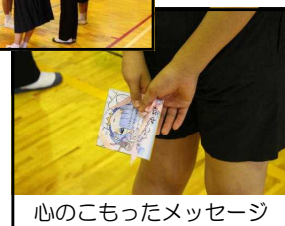
心のコもったメッセージ