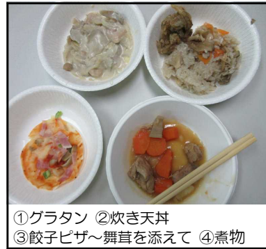
①グラタン ②炊き天丼 ③餃子ピザ〜舞茸を添えて ④煮物

生徒会レクがありました。(丹波の食材である 舞茸 or ジャガイモ を使った料理選手権) 写真にあるような料理が作られました。生徒たちはメニュー作成から試作まで、とても楽しんでいました。