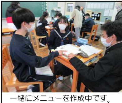
一緒にメニューを作成中です。