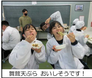
舞茸天ぷら おいしそうです！