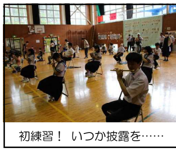
初練習！ いつか披露を……