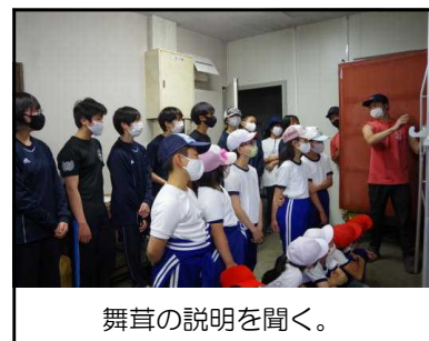
舞茸の説明を聞く。